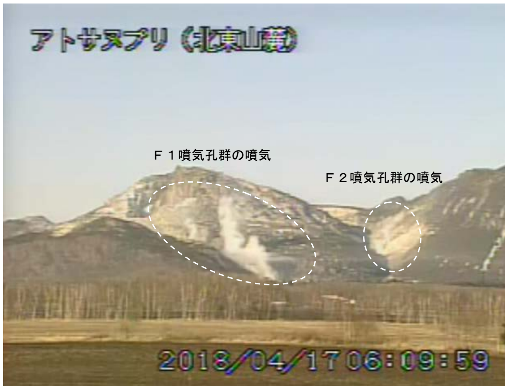
図2 アトサヌプリ 北東側から見た山体の状況 (4月17日、北東山麓監視カメラによる)