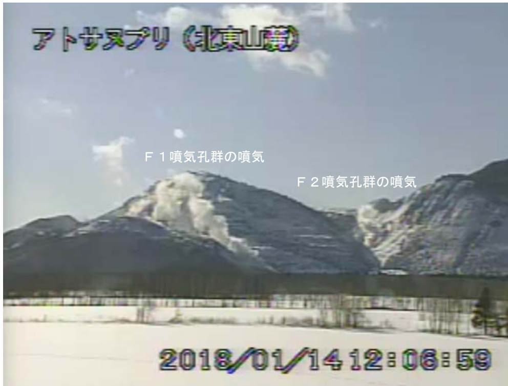
図2 アトサヌプリ 北東側から見た山体の状況 (1月14日、北東山麓監視カメラによる)