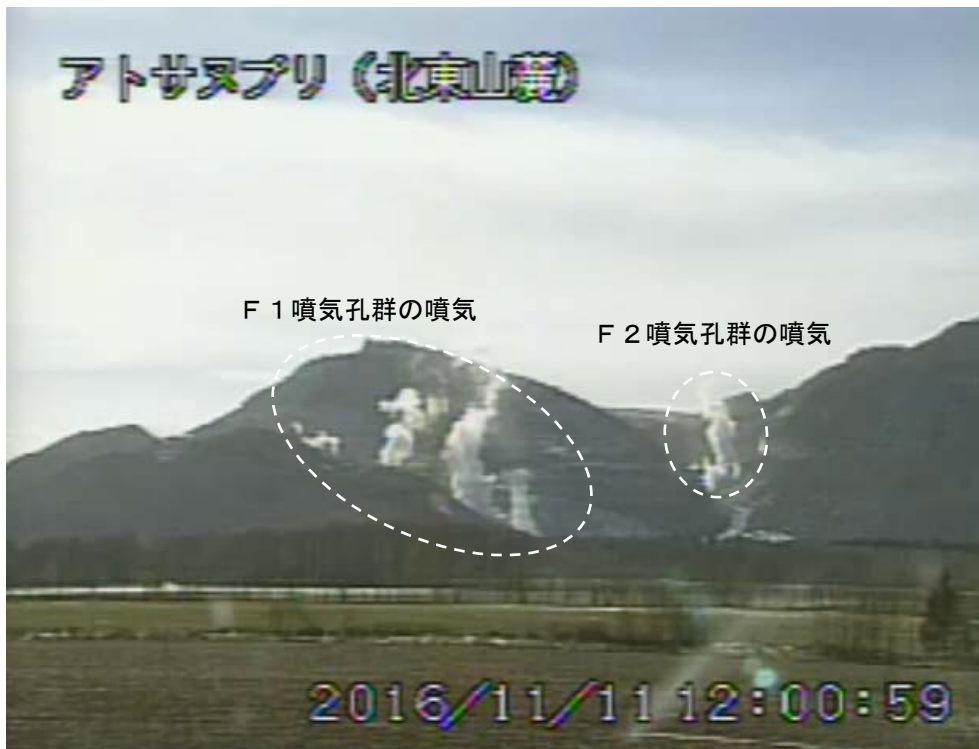
図2 アトサヌプリ 北東側から見た山体の状況 (11月11日、北東山麓遠望カメラによる)