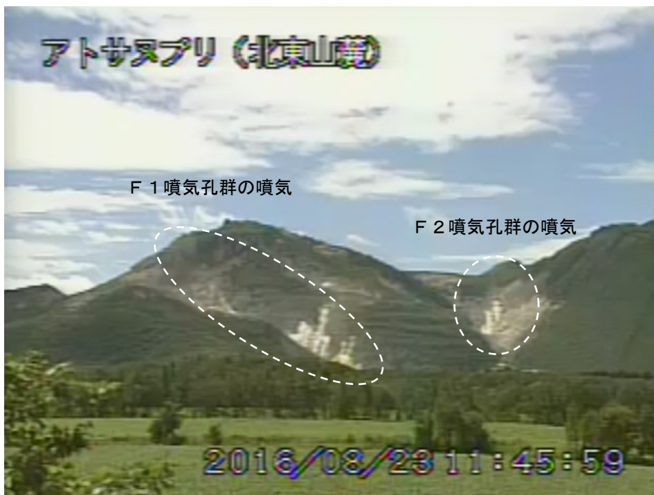
図2 アトサヌプリ 北東側から見た山体の状況 (8月23日、北東山麓遠望カメラによる)