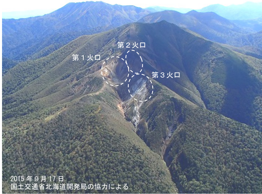
図2 丸山 全景 北西側上空（図1-①）から撮影