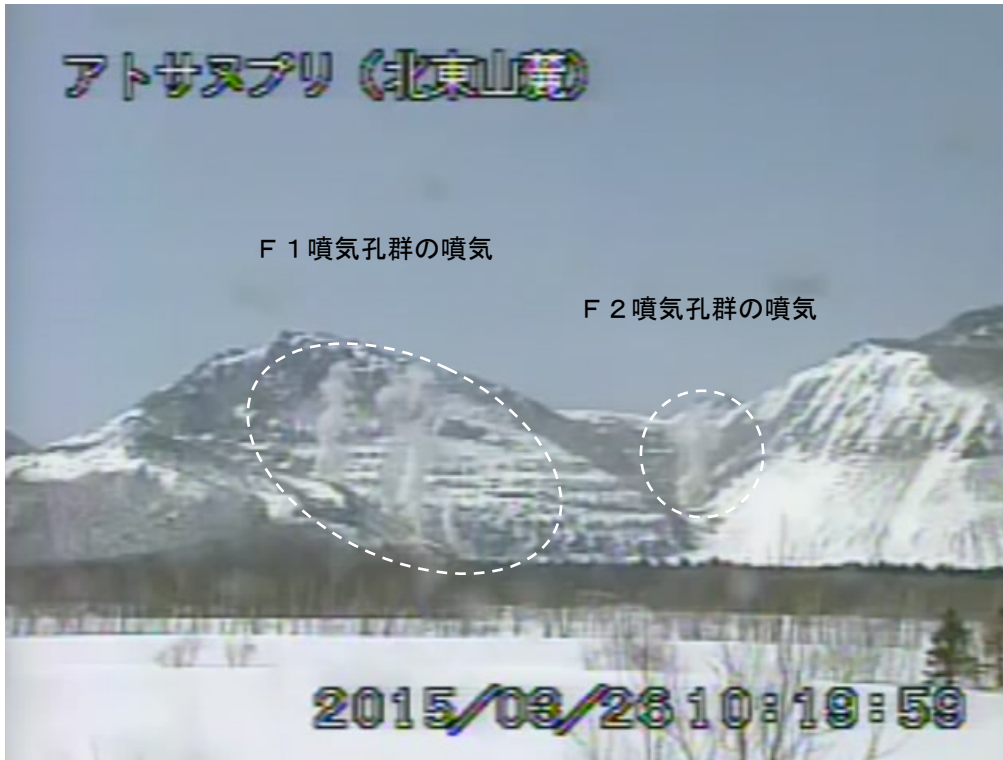
図2 アトサヌプリ 北東側から見た山体の状況 (3月26日、北東山麓遠望カメラによる)