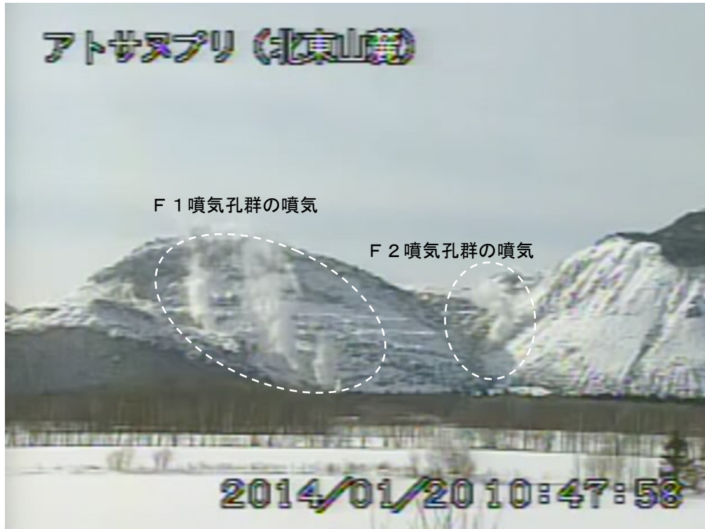
図2 アトサヌプリ 北東側から見た山体の状況 (1月20日、北東山麓遠望カメラによる)