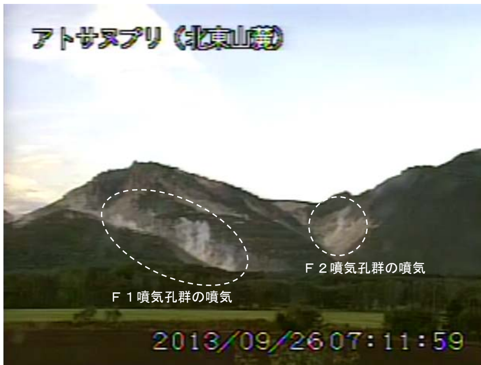
図2 アトサヌプリ 北東側から見た山体の状況 (9月26日、北東山麓遠望カメラによる)