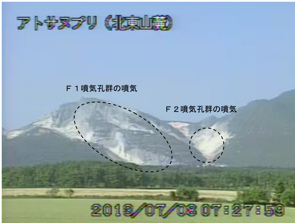
図2 アトサヌプリ 北東側から見た山体の状況 (7月8日、北東山麓遠望カメラによる)