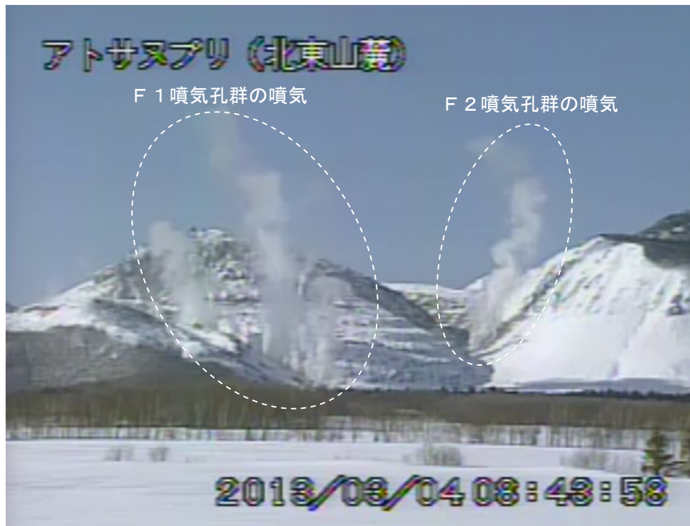
図2 アトサヌプリ 北東側から見た山体の状況 (3月4日、北東山麓遠望カメラによる)