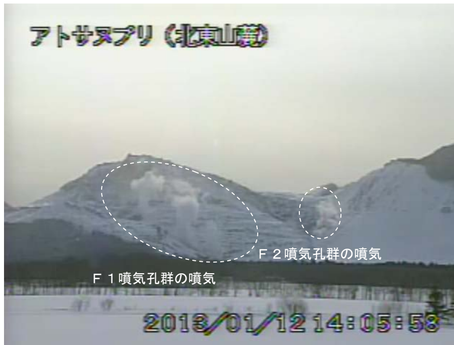
図 2 アトサヌプリ 北東側から見た山体の状況 （1月12日、北東山麓遠望カメラによる）