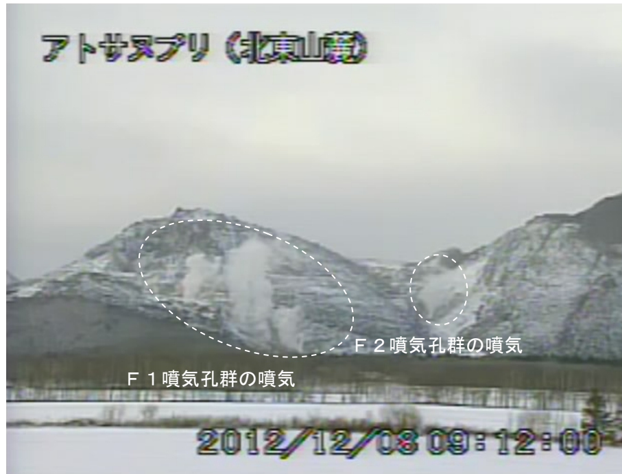
図2 アトサヌプリ 山体北側の状況 (12月8日、北東山麓遠望カメラによる)