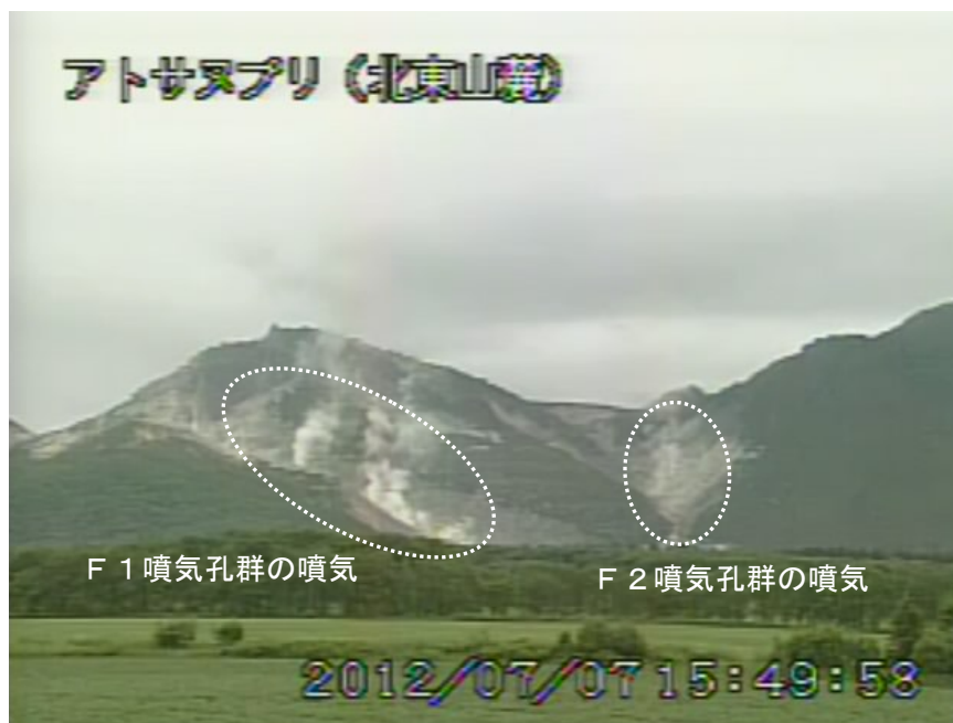
図1 アトサヌプリ 山体北側の状況（7月7日、北東山麓遠望カメラによる）

この火山活動解説資料は札幌管区気象台のホームページ( http://www.jma-net.go.jp/sapporo/ )や気象庁のホームページ( http://www.seisvol.kishou.go.jp/tokyo/volcano.html )でも閲覧することができます。