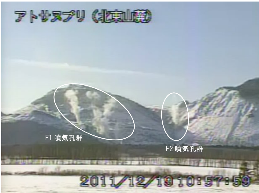
図2 アトサヌプリ 山体北側の状況 (12月19日、北東山麓遠望カメラによる) 白丸内はF1 噴気孔群及びF2 噴気孔群からの噴気