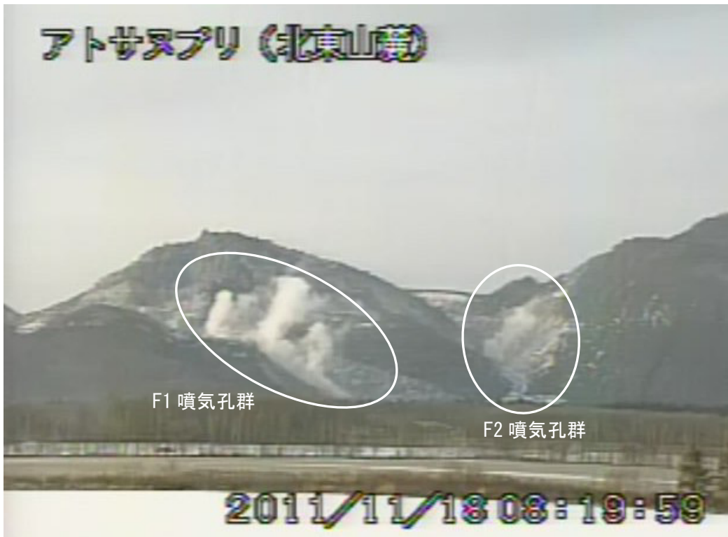
図2 アトサヌプリ 山体北側の状況 (11月18日、北東山麓遠望カメラによる) 白丸内はF1噴気孔群及びF2噴気孔群からの噴気