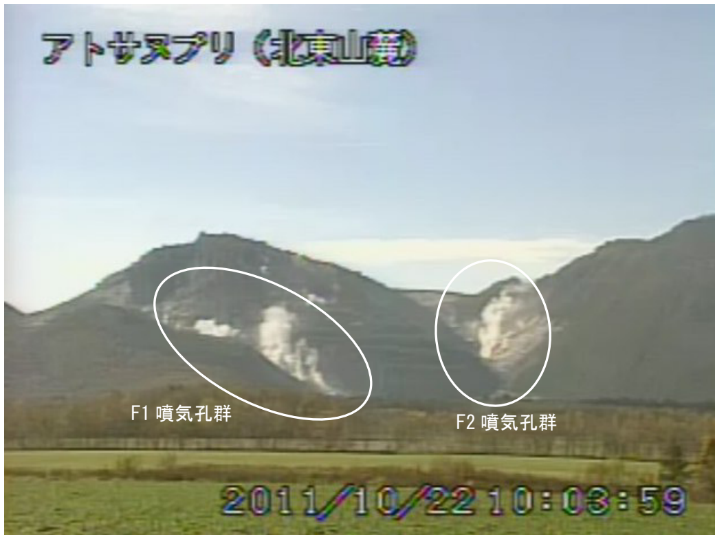
図2 アトサヌプリ 山体北側の状況 (10月22日、北東山麓遠望カメラによる) 白丸内はF1 噴気孔群及びF2 噴気孔群からの噴気