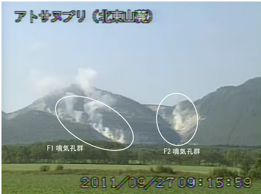
図2 アトサヌプリ 山体北側の状況 (9月27日、北東山麓遠望カメラによる) 白丸内はF1 噴気孔群及びF2 噴気孔群からの噴気