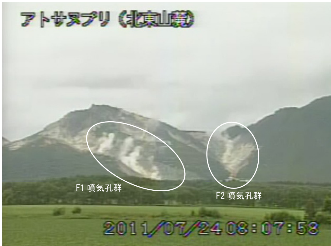
図2 アトサヌプリ 山体北側の状況 (7月24日、北東山麓遠望カメラによる) 白丸内はF1 噴気孔群及びF2 噴気孔群からの噴気