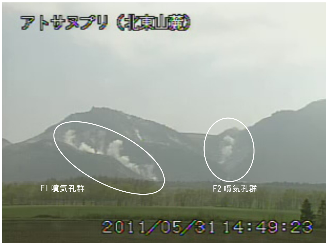
図2 アトサヌプリ 山体北側の状況 (5月31日、北東山麓遠望カメラによる) 白丸内はF1 噴気孔群及びF2 噴気孔群からの噴気