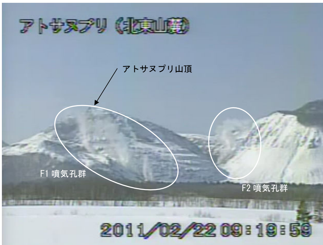
図2 アトサヌプリ 山体北側のF1・F2噴気孔群の噴煙状況(2月22日) 北東山麓遠望カメラ(アトサヌプリ山頂から北東3.8km)による。 白丸内が噴煙で、高さはそれぞれ火口縁上約200m。