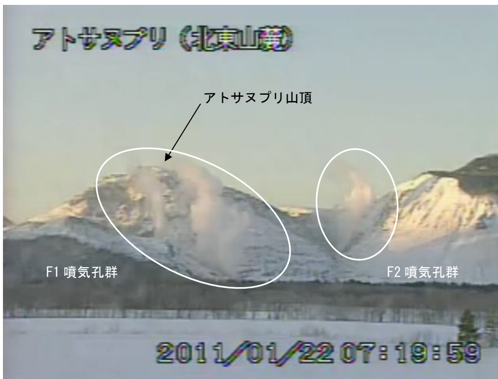
図2 アトサヌプリ 山体北側のF1・F2噴気孔群の噴煙状況（1月22日） 北東山麓遠望カメラ（アトサヌプリ山頂から北東3.8km）による。 白丸内が噴煙で、高さはそれぞれ火口縁上約200m。