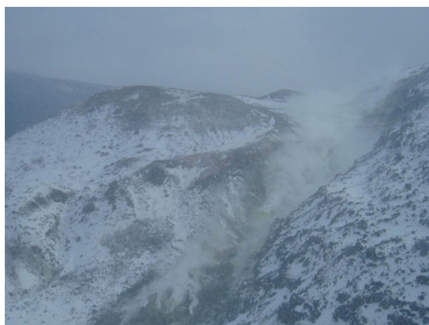
図2 アトサヌプリ 北側上空より撮影したF1噴気孔群（2007年3月1日、火口周辺図②から撮影）