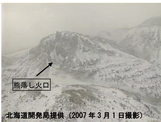
（2007年3月1日撮影）

溶岩ドームの山腹では、複数の噴気孔から立ち上る白色の噴気が認められましたが、前回（2006年10月）と比較して特に変化は認められませんでした。また、熊落し火口を含む溶岩ドームの山頂付近には噴気は確認されませんでした。