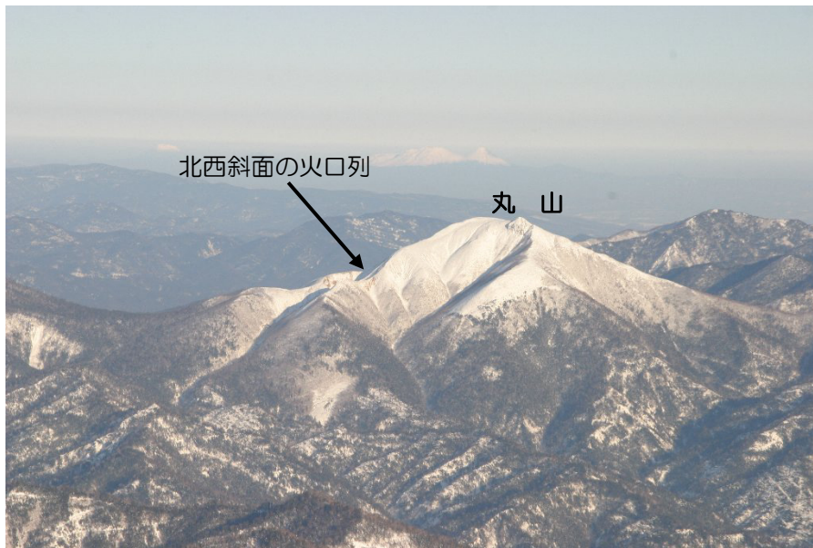
図1 丸山 全景（2月26日 西側上空から撮影）

北西斜面に連なる火口列（第1火口、第2火口、第3火口）の状況は前回（2005年9月）と比べて特に変化はなく、噴気も認められませんでした。