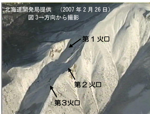
図2※ 丸山 北西斜面の火口列