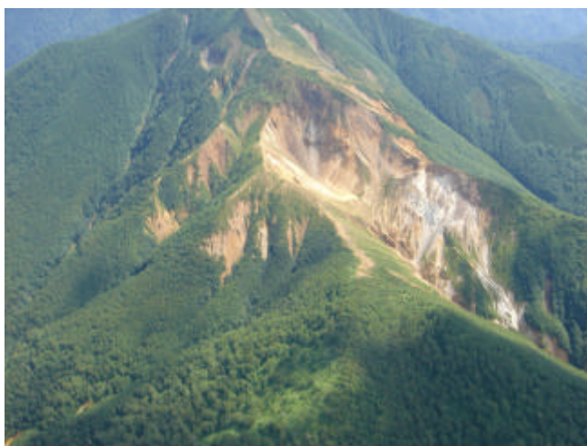
北側上空から撮影した丸山

8月24日に北海道開発局の協力を得て実施した上空からの観測で、北西斜面に連なる火口列(第1火口、第2火口、第3火口)の状況は、これまでと比べて特に変化は見られませんでした。現在は第3火口のみで地熱活動が続いていますが、今回の観測では噴気は認められませんでした。赤外熱映像装置*による観測では、第3火口で地熱活動に対応する高温域が認められました。それ以外の温度の高い部分は日射の影響によるものと考えられます。