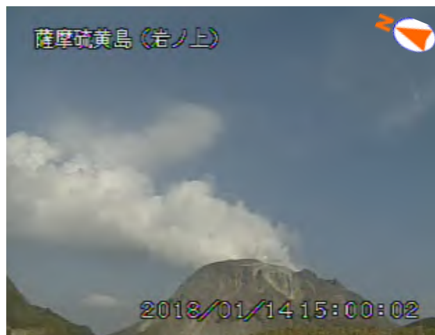
図 1 薩摩硫黄島 噴煙の状況（1 月 14 日、岩ノ上監視カメラによる）