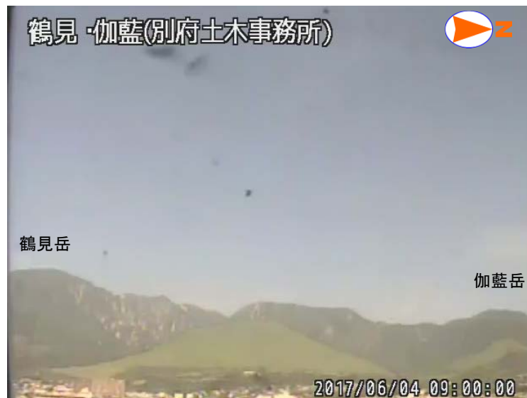
図 1 鶴見岳・伽藍岳 噴気の状態（6月4日、大分県監視カメラによる）

GNSS 1) 連続観測では、火山活動によると考えられる変化は認められませんでした。