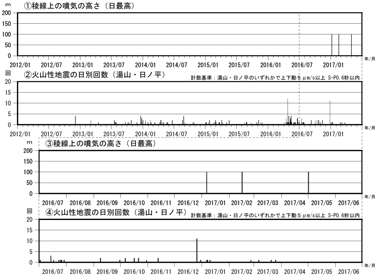
図2 鶴見岳・伽藍岳 火山活動経過図（2012年1月～2017年6月）