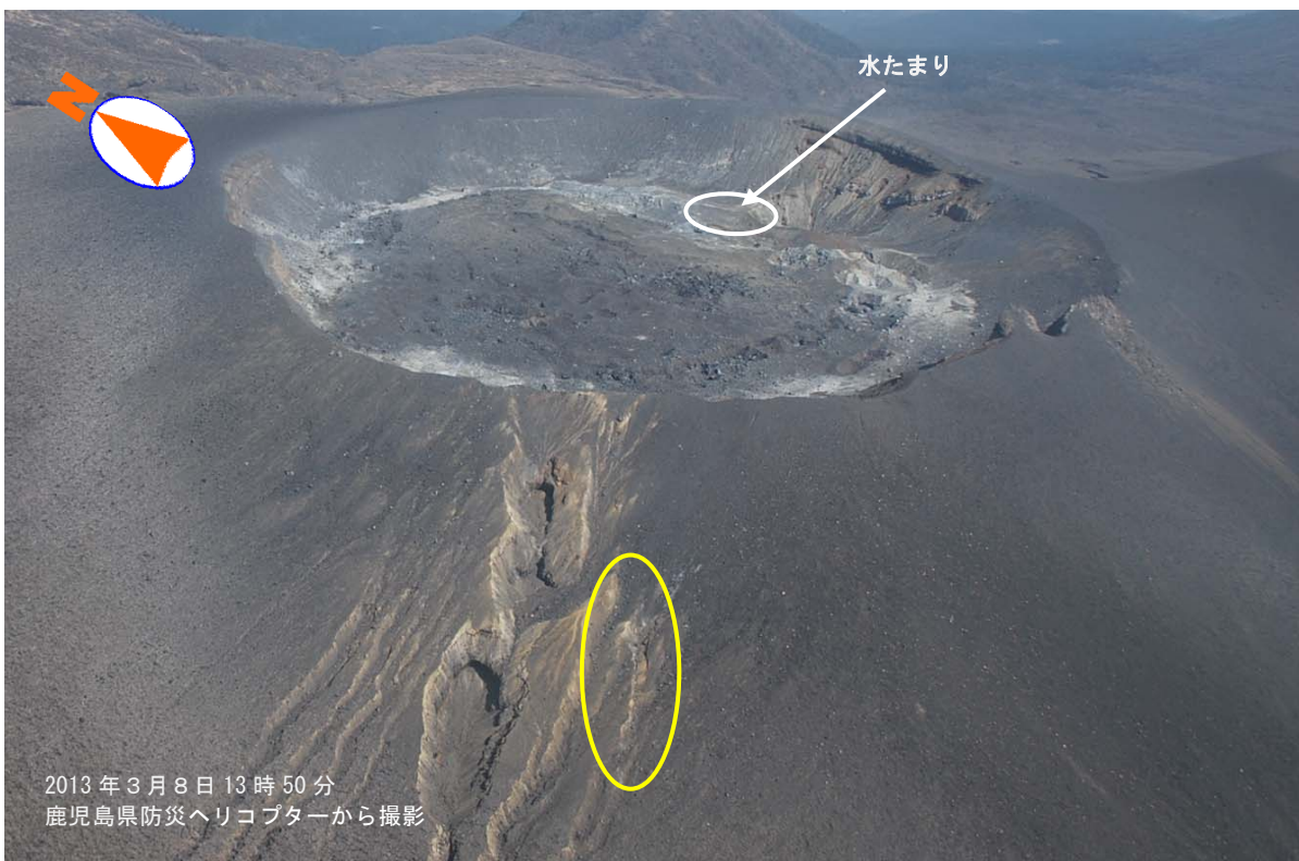
図1 霧島山（新燃岳） 火口内の状況