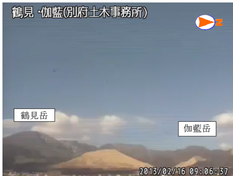
図 1※ 鶴見岳・伽藍岳 鶴見岳・伽藍岳の状況 （2 月 16 日、鶴見岳監視カメラ（大分県）による）

この火山活動解説資料は福岡管区气象台ホームページ（ http://www.jma-net.go.jp/fukuoka/ ）や気象庁ホームページ（ http://www.seisvol.kishou.go.jp/tokyo/volcano.html ）でも閲覧することができます。次回の火山活動解説資料（平成 25 年 3 月分）は平成 25 年 4 月 8 日に発表する予定です。