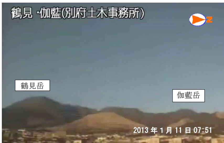
図 1※ 鶴見岳・伽藍岳 鶴見岳・伽藍岳の状況 （1 月 11 日、鶴見岳監視カメラ（大分県）による）

この火山活動解説資料は福岡管区気象台ホームページ（ http://www.jma-net.go.jp/fukuoka/ ）や気象庁ホームページ（ http://www.seisvol.kishou.go.jp/tokyo/volcano.html ）でも閲覧することができます。次回の火山活動解説資料（平成 25 年 2 月分）は平成 25 年 3 月 8 日に発表する予定です。