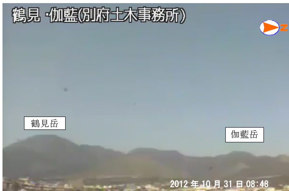
図 1※ 鶴見岳・伽藍岳 監視カメラによる鶴見岳・伽藍岳の状況 （10 月 31 日、鶴見岳監視カメラ（大分県）による）

この火山活動解説資料は福岡管区气象台ホームページ（ http://www.jma-net.go.jp/fukuoka/ ）や気象庁ホームページ（ http://www.seisvol.kishou.go.jp/tokyo/volcano.html ）でも閲覧することができます。次回の火山活動解説資料（平成 24 年 11 月分）は平成 24 年 12 月 10 日に発表する予定です。 ※この資料は気象庁のほか、国土地理院、独立行政法人防災科学技術研究所、大分県のデータも利用して作成しています。