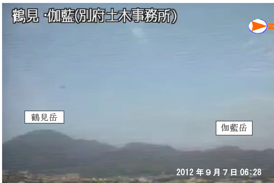
図 1※ 鶴見岳・伽藍岳 監視カメラによる鶴見岳・伽藍岳の状況