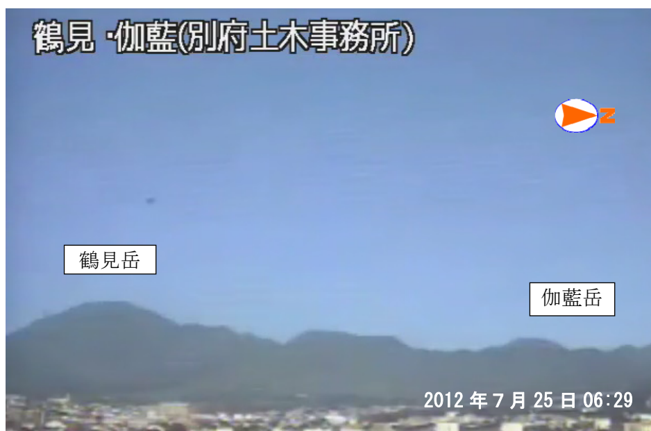
図 1※ 鶴見岳・伽藍岳 監視カメラによる鶴見岳・伽藍岳の状況