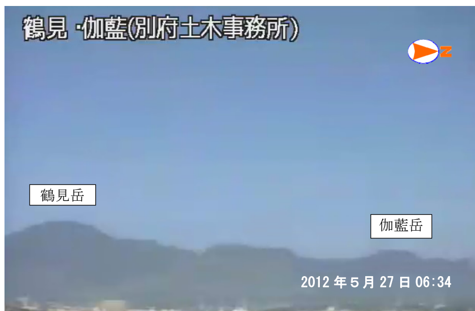
図 1※ 鶴見岳・伽藍岳 遠望カメラによる鶴見岳・伽藍岳の状況 （5 月 27 日、鶴見岳監視カメラ（大分県）による）

この火山活動解説資料は福岡管区气象台ホームページ（ http://www.jma-net.go.jp/fukuoka/ ）や気象庁ホームページ（ http://www.seisvol.kishou.go.jp/tokyo/volcano.html ）でも閲覧することができます。次回の火山活動解説資料（平成 24 年 6 月分）は平成 24 年 7 月 9 日に発表する予定です。 ※この資料は気象庁のほか、国土地理院、独立行政法人防災科学技術研究所、大分県のデータも利用して作成しています。