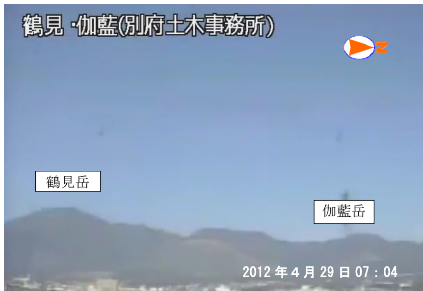
図 1※ 鶴見岳・伽藍岳 遠望カメラによる鶴見岳・伽藍岳の状況 （4 月 29 日、鶴見岳監視カメラ（大分県）による）

この火山活動解説資料は福岡管区气象台ホームページ（ http://www.jma-net.go.jp/fukuoka/ ）や気象庁ホームページ（ http://www.seisvol.kishou.go.jp/tokyo/volcano.html ）でも閲覧することができます。次回の火山活動解説資料（平成 24 年 5 月分）は平成 24 年 6 月 8 日に発表する予定です。 ※この資料は気象庁のほか、国土地理院、独立行政法人防災科学技術研究所、大分県のデータも利用して作成しています。