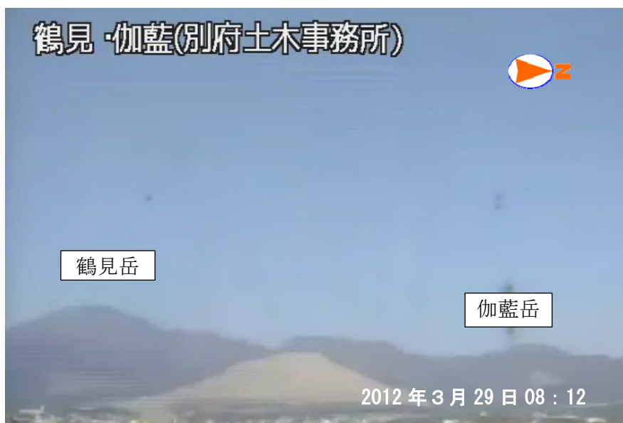
図 1※ 鶴見岳・伽藍岳 遠望カメラによる鶴見岳・伽藍岳の状況 （3月29日、鶴見岳監視カメラ（大分県）による）

この火山活動解説資料は福岡管区気象台ホームページ（ http://www.jma-net.go.jp/fukuoka/ ）や気象庁ホームページ（ http://www.seisvol.kishou.go.jp/tokyo/volcano.html ）でも閲覧することができます。次回の火山活動解説資料（平成 24 年 4 月分）は平成 24 年 5 月 10 日に発表する予定です。