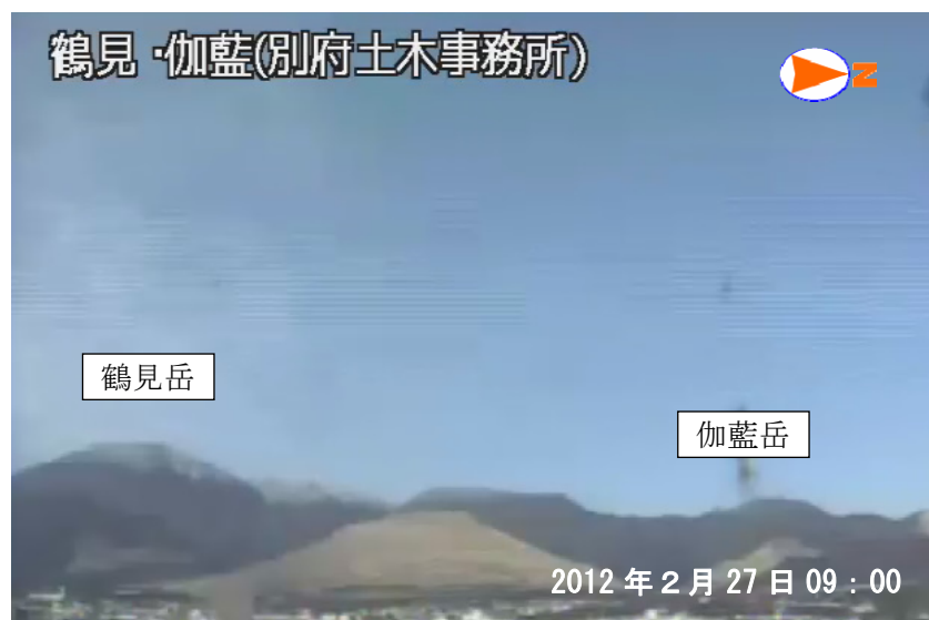
図 1 鶴見岳・伽藍岳 遠望カメラによる鶴見岳・伽藍岳の状況