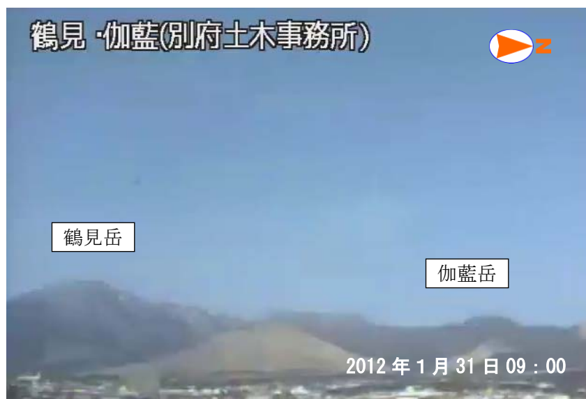
図 1 鶴見岳・伽藍岳 遠望カメラによる鶴見岳・伽藍岳の状況 （1 月 31 日、鶴見岳監視カメラ（大分県）による）

この火山活動解説資料は福岡管区气象台ホームページ（ http://www.jma-net.go.jp/fukuoka/ ）や気象庁ホームページ（ http://www.seisvol.kishou.go.jp/tokyo/volcano.html ）でも閲覧することができます。次回の火山活動解説資料（平成 24 年 2 月分）は平成 24 年 3 月 8 日に発表する予定です。