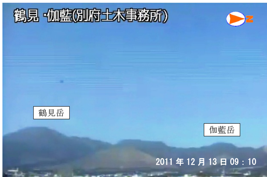
図 1 鶴見岳・伽藍岳 遠望カメラによる鶴見岳・伽藍岳の状況