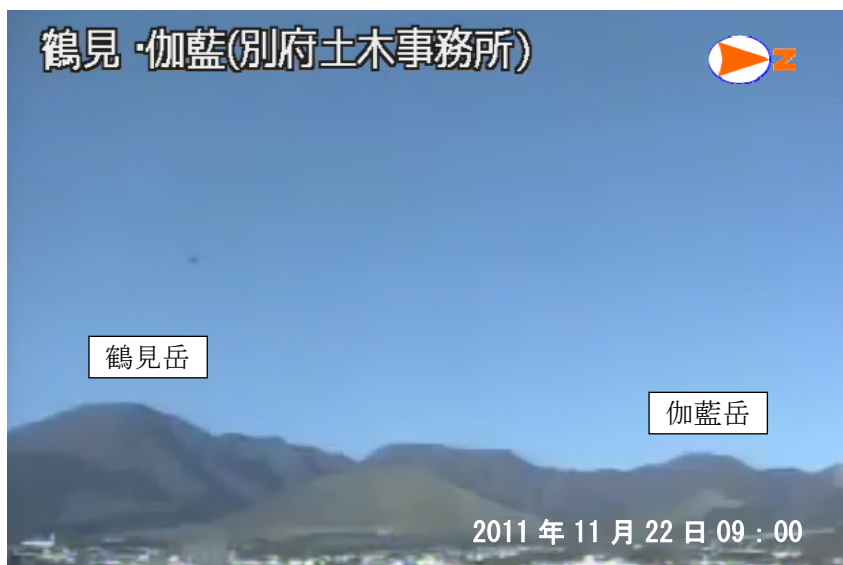
図 1 鶴見岳・伽藍岳 鶴見岳・伽藍岳の状況（11 月 22 日、鶴見岳監視カメラ（大分県）による） 噴気は認められませんでした。

この火山活動解説資料は福岡管区気象台ホームページ（ http://www.jma-net.go.jp/fukuoka/ ）や気象庁ホームページ（ http://www.seisvol.kishou.go.jp/tokyo/volcano.html ）でも閲覧することができます。次回の火山活動解説資料（平成 23 年 12 月分）は平成 24 年 1 月 10 日に発表する予定です。