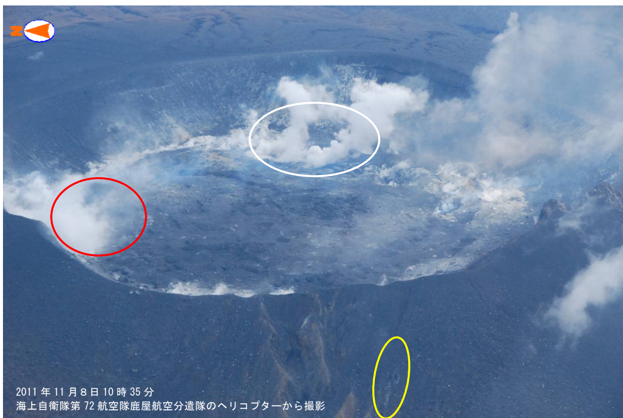
図1 霧島山（新燃岳） 火口内の状況