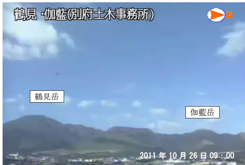
図 1 鶴見岳・伽藍岳 鶴見岳・伽藍岳の状況（10 月 26 日、鶴見岳監視カメラ（大分県）による） 噴気は認められませんでした。

この火山活動解説資料は福岡管区气象台ホームページ（ http://www.jma-net.go.jp/fukuoka/ ）や気象庁ホームページ（ http://www.seisvol.kishou.go.jp/tokyo/volcano.html ）でも閲覧することができます。次回の火山活動解説資料（平成 23 年 11 月分）は平成 23 年 12 月 8 日に発表する予定です。