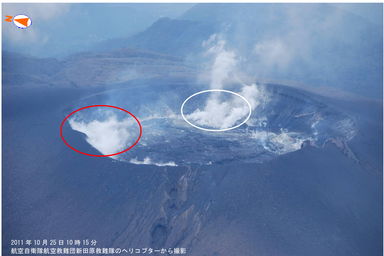
図1 霧島山（新燃岳） 火口内の状況