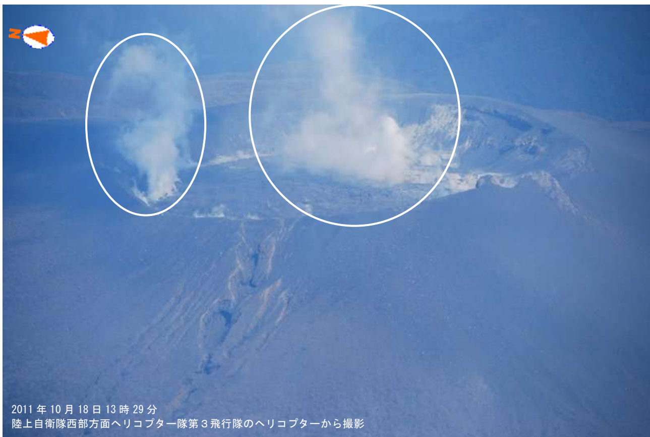
図1 霧島山（新燃岳） 火口内の状況