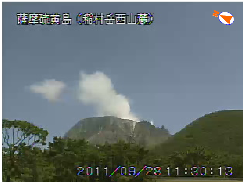
図 1 薩摩硫黄島 噴煙の状況（9 月 28 日、稲村岳西山麓遠望カメラによる）

この火山活動解説資料は福岡管区气象台ホームページ（ http://www.jma-net.go.jp/fukuoka/ ）や気象庁ホームページ（ http://www.seisvol.kishou.go.jp/tokyo/volcano.html ）でも閲覧することができます。次回の火山活動解説資料（平成 23 年 10 月分）は平成 23 年 11 月 9 日に発表する予定です。資料中の地図の作成に当たっては、国土地理院長の承認を得て、同院発行の『数値地図 10mメッシュ（火山標高）』を使用しています（承認番号：平 20 業使、第 385 号）。