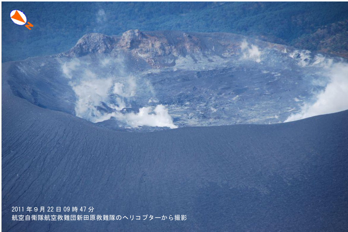
図 1 霧島山（新燃岳） 火口内の状況