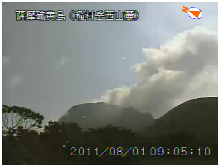
図 1 薩摩硫黄島 噴煙の状況（8 月 1 日、稲村岳西山麓遠望カメラによる）

この火山活動解説資料は福岡管区气象台ホームページ（ http://www.jma-net.go.jp/fukuoka/ ）や気象庁ホームページ（ http://www.seisvol.kishou.go.jp/tokyo/volcano.html ）でも閲覧することができます。次回の火山活動解説資料（平成 23 年 9 月分）は平成 23 年 10 月 6 日に発表する予定です。資料中の地図の作成に当たっては、国土地理院長の承認を得て、同院発行の『数値地図 10m メッシュ（火山標高）』を使用しています（承認番号：平 20 業使、第 385 号）。