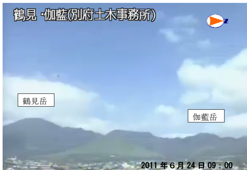
図 1 鶴見岳・伽藍岳 遠望観測の状況（6 月 24 日、鶴見岳監視カメラ（大分県）による）

この火山活動解説資料は福岡管区气象台ホームページ（ http://www.jma-net.go.jp/fukuoka/ ）や気象庁ホームページ（ http://www.seisvol.kishou.go.jp/tokyo/volcano.html ）でも閲覧することができます。次回の火山活動解説資料（平成 23 年 7 月分）は平成 23 年 8 月 4 日に発表する予定です。