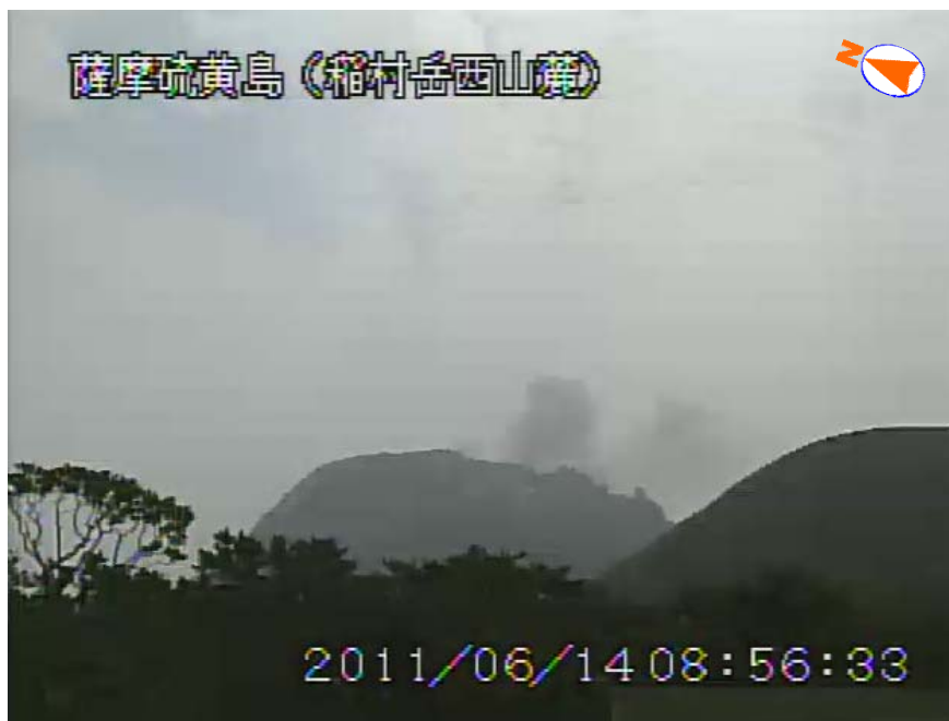
図 1 薩摩硫黄島 噴煙の状況（6 月 14 日、稲村岳西山麓遠望カメラによる）

火山性地震の月回数は 149 回（5 月：152 回）で、少ない状態で経過しました。振幅が小さく継続時間の短い火山性微動を 1 回（5 月：1 回）観測しました。