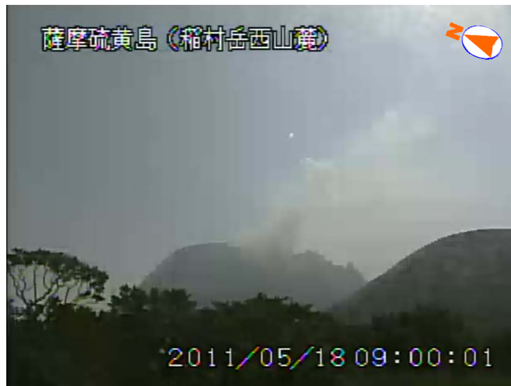
図 1 薩摩硫黄島 噴煙の状況（5 月 18 日、稲村岳西山麓遠望カメラによる）

この火山活動解説資料は福岡管区气象台ホームページ ( http://www.jma-net.go.jp/fukuoka/ ) や気象庁ホームページ ( http://www.seisvol.kishou.go.jp/tokyo/volcano.html ) でも閲覧することができます。次回の火山活動解説資料（平成 23 年 6 月分）は平成 23 年 7 月 8 日に発表する予定です。資料中の地図の作成に当たっては、国土地理院長の承認を得て、同院発行の『数値地図 10m メッシュ（火山標高）』を使用しています（承認番号：平 20 業使、第 385 号）。