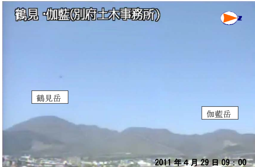
図 1 鶴見岳・伽藍岳 遠望観測の状況（4 月 29 日、鶴見岳監視カメラ（大分県）による）

この火山活動解説資料は福岡管区気象台ホームページ（ http://www.jma-net.go.jp/fukuoka/ ）や気象庁ホームページ（ http://www.seisvol.kishou.go.jp/tokyo/volcano.html ）でも閲覧することができます。次回の火山活動解説資料（平成 23 年 5 月分）は平成 23 年 6 月 8 日に発表する予定です。